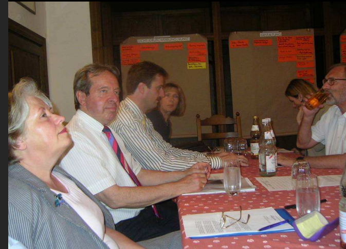
Stadt Hof: Aufwertung der Altstadt - 3. Vorbereitungsrunde mit den Einzelhändlern der Hofer Altstadt

Endgültige Abstimmung mit Regierung von Schwaben | Bayerische Architektenkammer