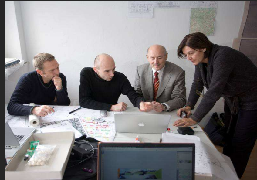
Während des Planungsprozesses