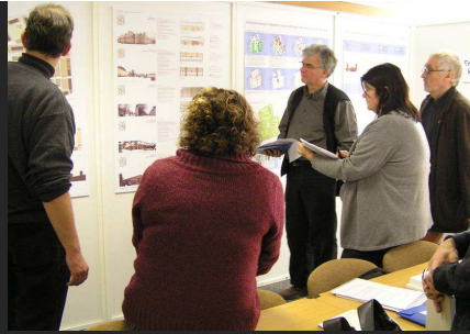
Die Jury bei der Entscheidungsfindung