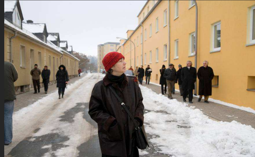
Beim Rundgang durch das Gebiet

Sie erarbeiten, diskutieren und präsentieren ihre Vorschläge öffentlich vor Ort.