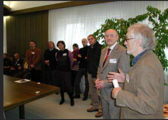
Begrüßung der Teams