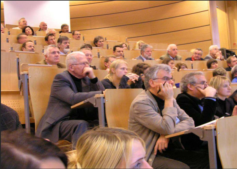
Auditorium während der Präsentation im Audimax der Fachhochschule Hof

Die Architekten präsentieren die Ergebnisse und diskutieren mit dem Auditorium (Bürger | Kollegen | Verwaltung).