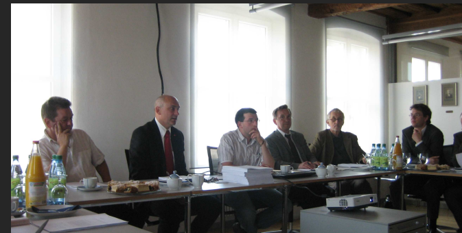
Stadt Hallstadt: Vorbereitungsrunde mit der Regierung und den Juroren